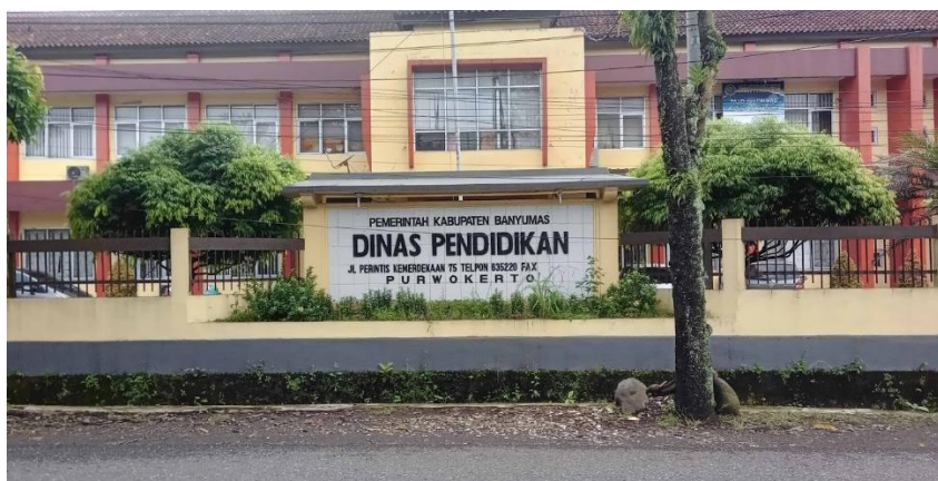
Gambar 1.1 Dinas Pendidikan Kabupaten Banyumas