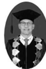
Dekan Fakultas Teknik