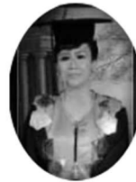
Wakil Rektor II - Bidang Administrasi & Keuangan