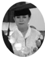
Dekan Fakultas Ekonomi