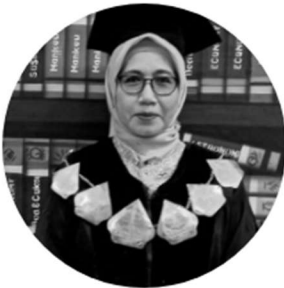
Wakil Rektor I - Bidang Akademik