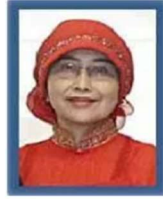
Ketua Yayasan Abdi Masyarakat Kota Semarang