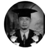
Wakil Rektor III - Bidang Kemahasiswaan